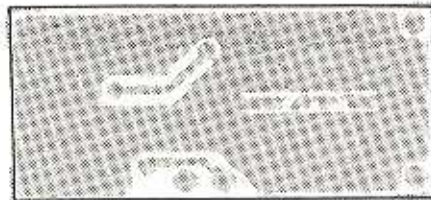
B - Seite